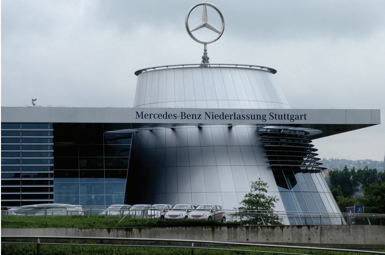
Mercedes-Benz Niederlassung Stuttgart

پس از نزدیک به دو سال نوبت به امضایشان رسید. قرارداد رنو، ایدرو و هلدینگ ناصح با سهم ۶۰ درصدی رنو و ۴۰ درصدی دو طرف ایرانی نهایتاً در مردادماه به امضا رسید. قرارداد تولید خودروهای تجاری میان بنز و ایران خودرو دیزل هم در روزهای آخر شهریور در فرانکفورت امضا شد. تا تعداد قراردادهای خودرویی رسماً امضا شده در پسابر جام به عدد ۴ برسد. اتفاقات مرور شده به ویژه امضای دو قرارداد اخیر می تواند برای صنعت خودروی ایران و صنعت قطعه سازی بسیار تاثیر گذار باشد. با رویکرد جدیدی که هدف تیم جدید مجله است، مطالبی از مهم ترین های آنچه پیشتر گفته شد می خوانید. همکاران ما در راز صنعت در نظر دارند هر شماره جذاب ترین رخدادها در حوزه خودرو و صنعت در قالب گزارش، گفت و گو و خبر را تولید و منتشر کنند؛ همچنین در هر شماره اینفوگرافی هایی از جذاب ترین اتفاق های صنعتی و خودرویی روز دنیا و همچنین سلبریتی ها و مقامات خارجی خواهیم داشت و گاه، شوخی هایی در این حوزه در صفحه کمیک استریپ خستگی شما را در خواهد کرد. با راز صنعت همراه باشید.